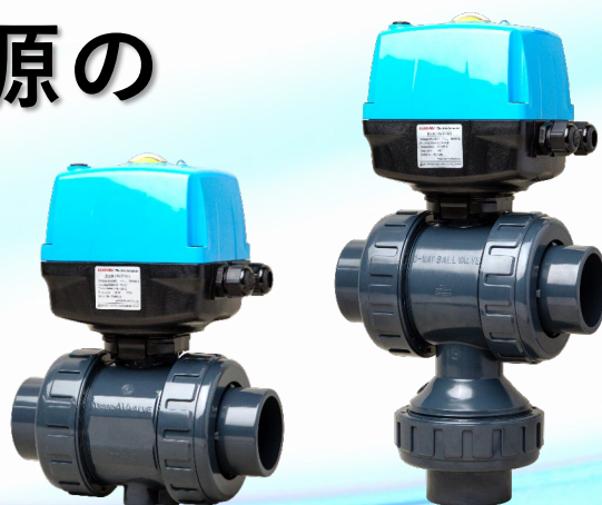
ボールバルブ21・21α型