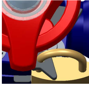
南京錠取り付け状態