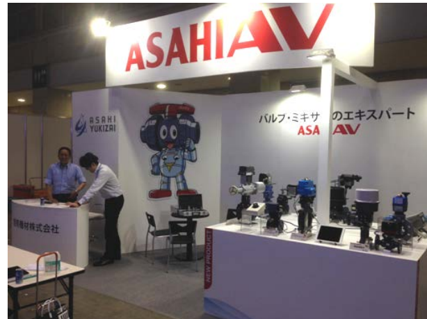
< 出展準備の様子 >

今回、混合器(ミキサー)各種への関心が高く、2液の混合ムラに係る課題を持つお客様に対し、混合器の適切な選定や配管方法などをお伝えすると、後日あらためて詳細を聞かせてほしいとのお声も頂戴しました。