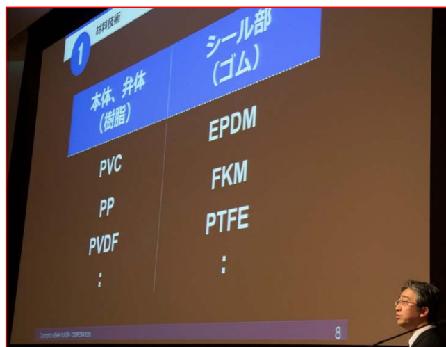
<材料技術に関する説明>

プライベート展示会では、製品の品質に関する動画、バルブ組立体験や耐食性能の可視化など「作るこだわり」の4ブースを、ウォーターハンマ対策バルブ、“Picoball”やジアブロックなどの新製品、自動バルブなど「使うこだわり」の11ブースの計15ブースを展示いたしました。展示会は活気を帯び、各ブースでは当社営業員、技術員が、代理店の方々に熱心に説明していました。参加された皆様から、「営業、新技術の取り組みに対するスピードが加速している」、「次世代バルブを楽しみにしている」など、数多くの感想をいただきました。