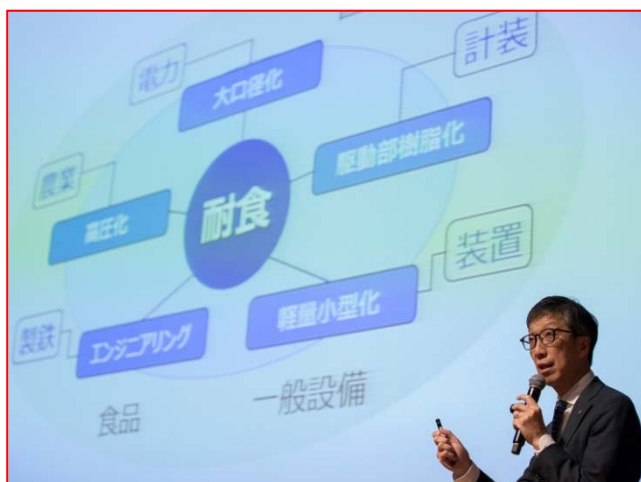
<耐食に関する説明>

2017年11月21日（火）、東京都（秋葉原）のアキバプラザにおいて、「ASAHIIV 営業方針・商品説明会」が開催されました。主に東日本地区における代理店の方々にご参加いただき、弊社事業および製品をより深く知っていただくために、営業に係るこれまでとこれからの取り組みを報告し、さらに製品の耐食、今後の営業・技術の方向性をご紹介しました。