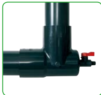
サンプリングやドレン抜き用のバルブ・コックの取り付け。