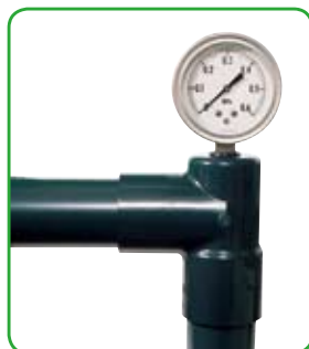
圧力計や温度計などの各種センサーの取り付け。