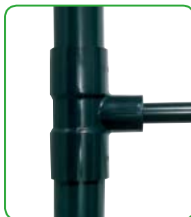
コンパクトな配管ラインの縮径（レデュース）。